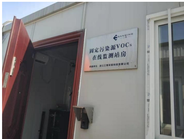
废气 VOCs 在线监测系统